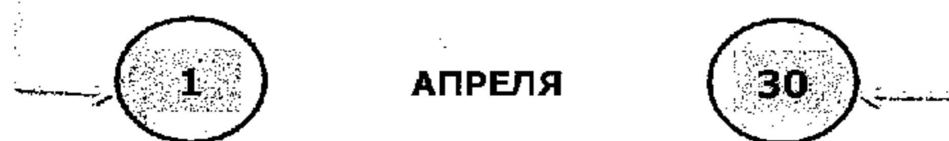
Схема 1. Представление сведений

Федеральные государственные служащие, служащие ЦБ РФ, работники ПФР, ФСС РФ, Федерального фонда ОМС, государственных корпораций и др.