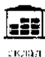
Схема 2. Недвижимое имущество

54. В соответствии со статьей 2 Федерального закона от 7 июля 2003 г. № 112-ФЗ «О личном подсобном хозяйстве» под личным подсобным хозяйством понимается форма непредпринимательской деятельности по производству и переработке сельскохозяйственной продукции. При этом для ведения личного подсобного хозяйства могут использоваться земельный участок в границах населенного пункта (приусадебный земельный участок) и земельный участок за пределами границ населенного пункта (полевой земельный участок). Приусадебный земельный участок используется для производства сельскохозяйственной продукции, а также для возведения жилого дома, производственных, бытовых и иных зданий, строений, сооружений с соблюдением градостроительных регламентов, строительных, экологических, санитарно-гигиенических,